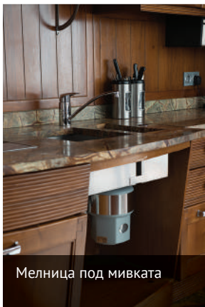
Мелница под мивката